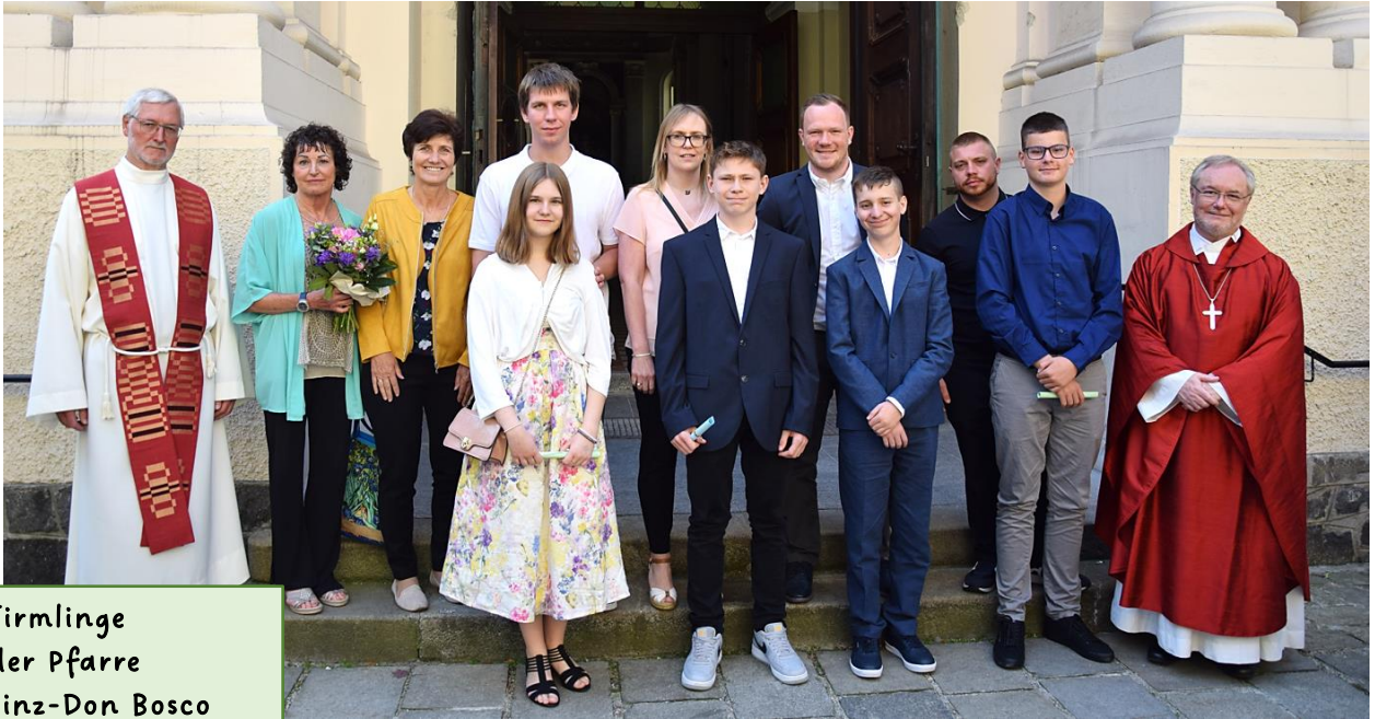
Firmlinge der Pfarre Linz-Don Bosco