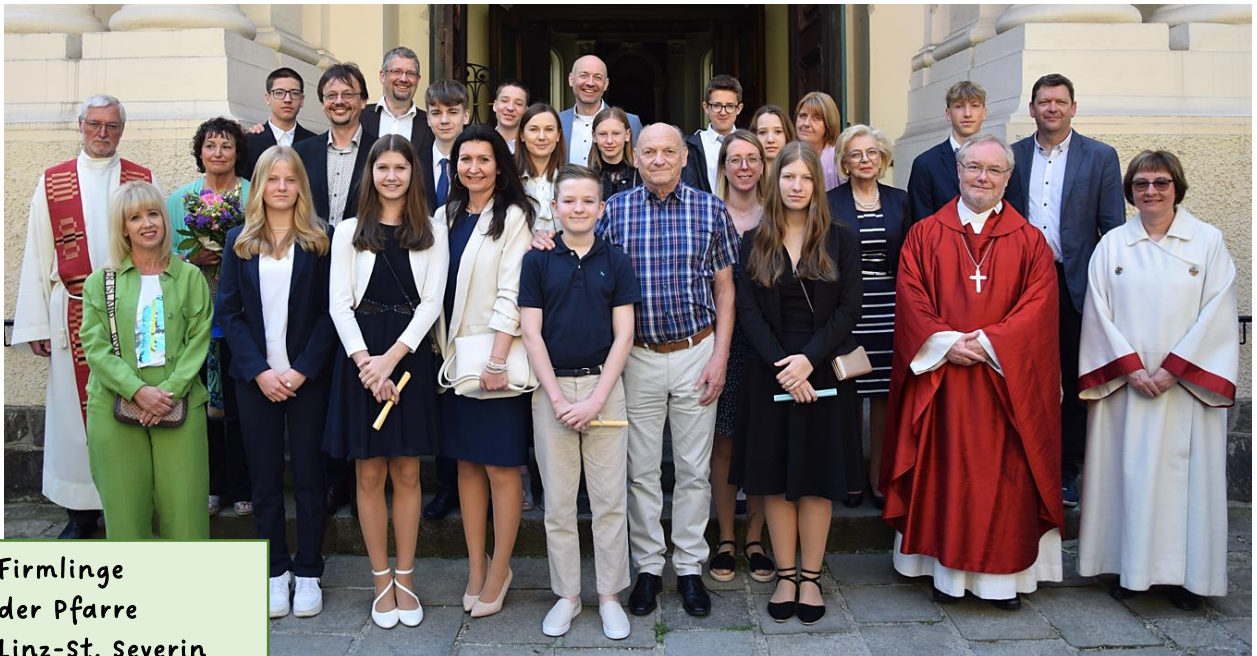
Firmlinge der Pfarre Linz-St. Severin