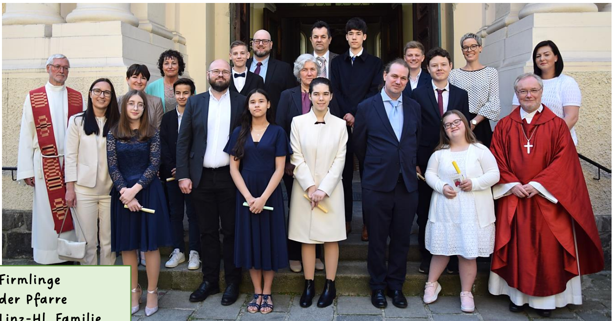
Firmlinge der Pfarre Linz-Hl. Familie