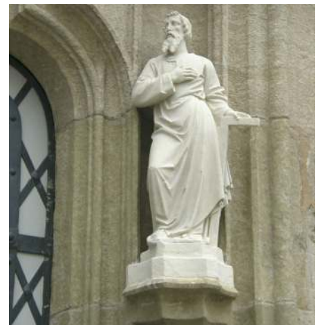
Die Heiligen kehren auf ihren gewohnten Platz zurück