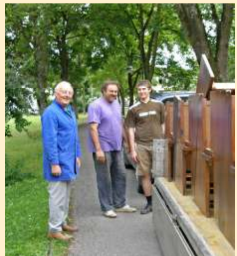
Die Kirchenbänke wurden ausgelagert