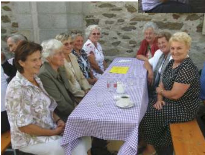
Nicht nur Familien, sondern auch „Damenrunden“ fühlten sich recht wohl