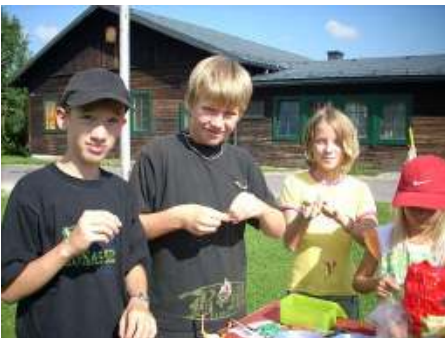
geschickt und kreativ

Vom 19. – 25. August 2007 organisierten engagierte junge Mädchen und Burschen im Rahmen der Kath. Jungschar wieder eine Lagerwoche. 50 Kinder, 12 BegleiterInnen, ein Koch und eine Köchin machten sich auf den Weg nach Ternberg. Das Jungscharlager stand heuer unter dem Motto „Weltreise“. Nordamerika, Asien, Afrika, Australien, Südamerika