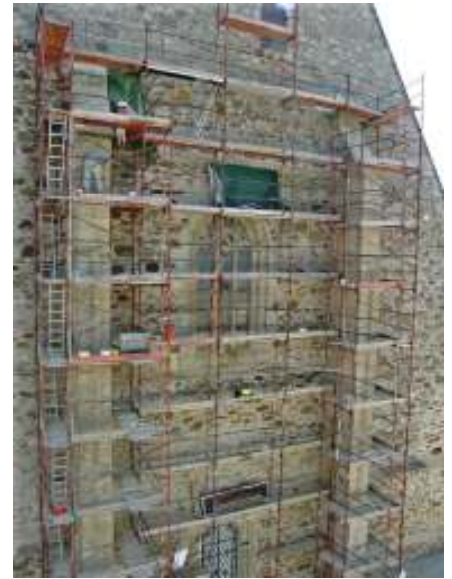
In schwindelnder Höhe wird handwerkliche Präzisionsarbeit geleistet