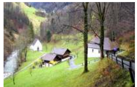
Bruder Klaus Kapelle

Wir freuen uns schon jetzt über Ihre zahlreiche Teilnahme. Genauere Informationen finden Sie im nächsten Pfarrblatt.