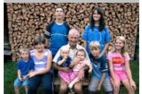
Opa ist der Beste