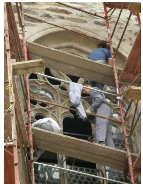
Die bunten Fenster vom Altarraum wurden bereits zur Sanierung gebracht